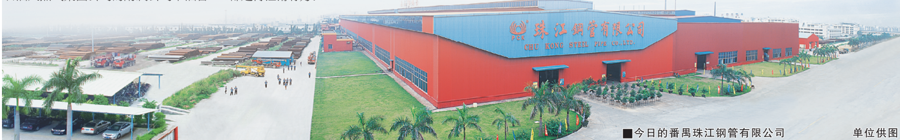
■今日的番禺珠江钢管有限公司