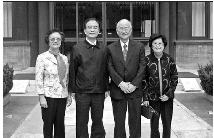
■2012年4月,温家宝偕夫人张培莉宴请吴康民夫妇合影