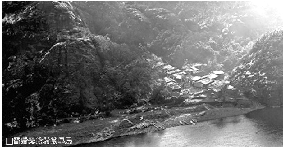
雪后无蚊村的早晨

泸溪河对岸便是新村，一栋栋两层小楼，白墙黛瓦，道路通达。新村古村摆渡相连，诗意生活共同向往。