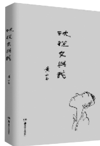
《沈从文与我》 黄永玉著 湖南美术出版社出版

在黄永玉的生活中,表叔一直占据着颇为重要的位置。沈从文是黄永玉写得最多、也是写得最丰富生动的一个人物。他钦佩表叔精神层面的坚韧,欣赏表叔那种从容不迫的人生姿态。他写表叔,不愿意用溢美之词,更不愿意将其拔高至如伟人一般高耸入云。《太阳下的风景》《这些忧郁的碎屑》《平常的沈从文》……他以这样的标题,多层面地写活了一个真实、立体的沈从文。从容,欣赏美,沉溺于创造,这样的沈从文,竖起一个高高的人生标杆。