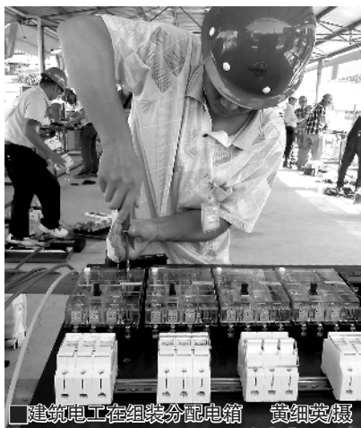
■建筑电工在组装配电箱

本报讯 (记者黄细英 通讯员梁嘉翌)身穿工装,头戴安全帽,建筑电工全副武装上阵,一把把螺丝刀、钳子在他们手中跳舞。7月28日,佛山市建设职业技能培训基地内,来自该市四区及佛山新城的40名建筑行业的电工,在汗流浹背中紧张地进行建筑电工技能竞赛。