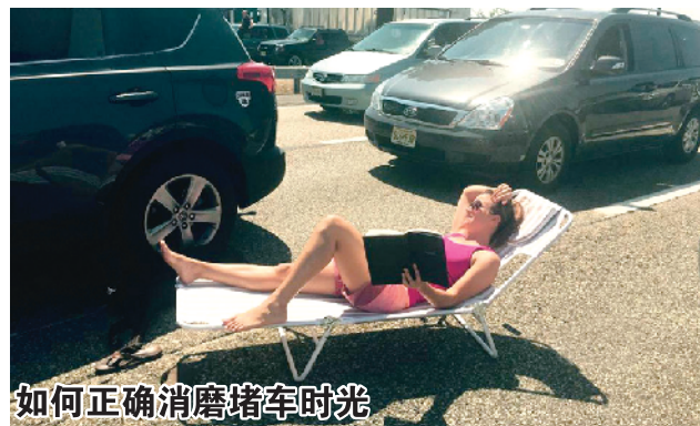
如何正确消磨堵车时光

重庆继水上麻将,造浪池麻将后,最近出现了冰窖麻将!包着大棉衣上阵……乡亲们真是走在“城会玩”的前列!