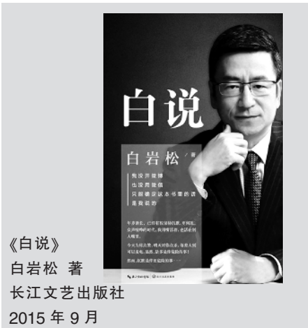
《白说》 白岩松 著 长江文艺出版社 2015年9月

近日,央视著名主持人、资深新闻评论员白岩松将推出自己的新书《白说》。这是白岩松继《幸福了吗》、《痛并快乐着》之后的全新作品。