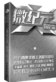
《微纪元》 北京理工大学出版社 刘慈欣、王晋康、 何夕、夏笳、江波、 阿缺、燕垒生等著 2015年10月