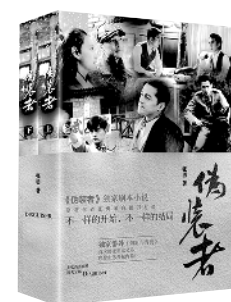
《伪装者》 张勇著 化学工业出版社 2016年1月

谍战剧《伪装者》一经播出后立刻成为了观众追捧的对象,成为2015年中国电视市场最亮的一颗星。日寇铁蹄下的上海滩,国、共、日、伪四方无形的角力,明氏四姐弟扑朔迷离的身份和真挚感人的情感关系,剑拔弩张、暗潮汹涌、骨肉亲情、人性挣扎……这一幕幕隐秘战线上的殊死较量,令每一位电视机前的观众都欲罢不能。