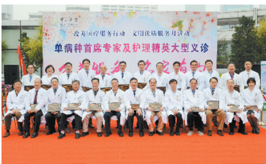
■专家团队开展大型义诊活动