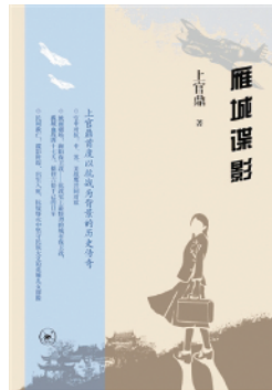
生活·读书·新知三联书店 刘兆玄 著 《雁城谍影》

台湾中华文化总会前任会长,著名武侠小说家刘兆玄,继2014年凭借小说《王道剑》重出江湖后,首度尝试以抗战为背景写作历史传奇。该书以作者故乡湖南衡阳为背景,以家族记忆为蓝图、父母亲为原型,糅合历史事件写就,捕捉中国军民血战八年保家卫国的光荣历史,以女性为主体观照战争阴影下个体命运的浮沉,展现一个空军将领后代的家国情怀。