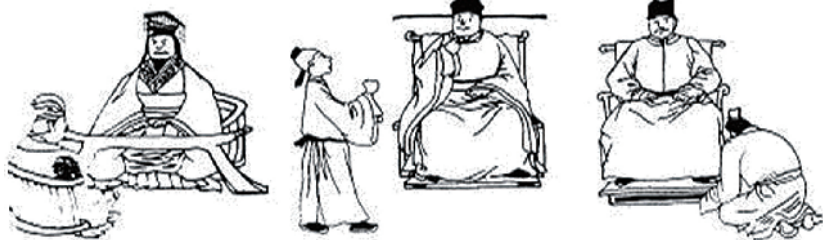
宰相讨论国事的不同时期,由坐着到站着再到跪着