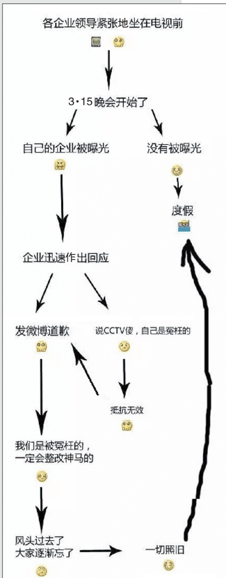
▲ 3·15晚会后被曝光企业回应套路

【总结】 不管修车大爷被大公司聘请的消息是否真实,小编认为有技术的人靠真本事吃饭,他们是最可爱的人。而在3·15晚会曝光的企业,错了就是错了,不要侥幸,做产品要有职业精神,要以消费者的生命健康为根本准则。