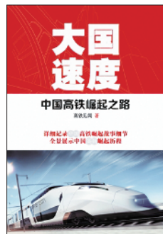
湖南科技出版社 高铁见闻著 中国高铁崛起之路 《大国速度》

如今,虽然铁路春运出行的人次依旧居高不下,但买到一张回家的车票早已不像过去那般“难于上青天”。在这人人能够亲身感受到的变化中,高铁已经悄然改变了中国30年的春运格局。该书全景式展示中国高铁崛起之路,记录了中国高铁从无到有,再到自主创新、高速发展,最后成为高铁强国的全过程。