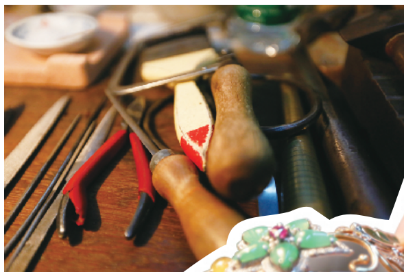
▲台面上摆满了各式各样叫不出名称的打金工具刀