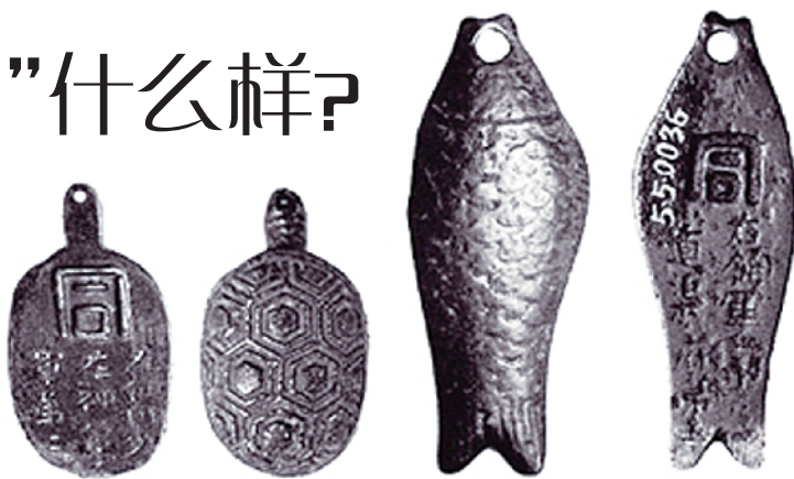
■古代龟符和鱼符的正反面 资料配图