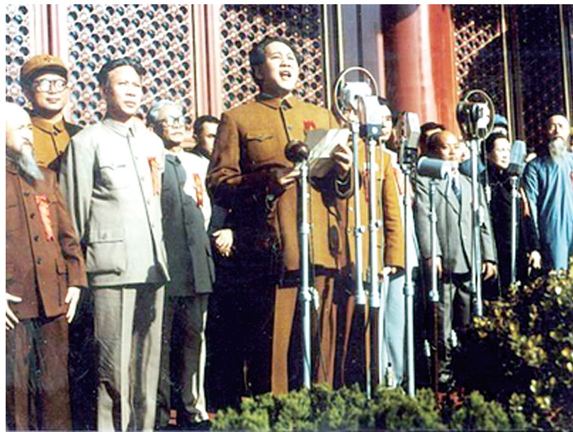
■影视剧中的开国大典场景,左一即是电影中司徒美堂形象

当时日本特务威胁他,让他替日本人办事。此时已经75岁高龄的司徒美堂想都没想就回答道:“我已年逾古稀,不想在入土之前背黑锅,那样犹如贞妇白头失守,半生之清苦俱非。所以我决意不当什么维持会长。”