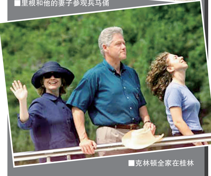
■克林顿全家在桂林

于是,里根总统成了建国后第一位访问西安的美国总统。和特朗普一样,这位总统在铁血强硬的背后也有着幽默的一面。在参观兵马俑的时候,他问中方陪同人员:“我能用手摸一摸这匹马吗?我猜它是不会踢我的。”在得到同意后,他仔细观看了几个兵马俑,并且用手摸了摸。当参观结束的时候,里根爬上了木梯,对兵马俑说了句“解散”。考虑到此时他已经73岁,可以称之为“老顽童”了。