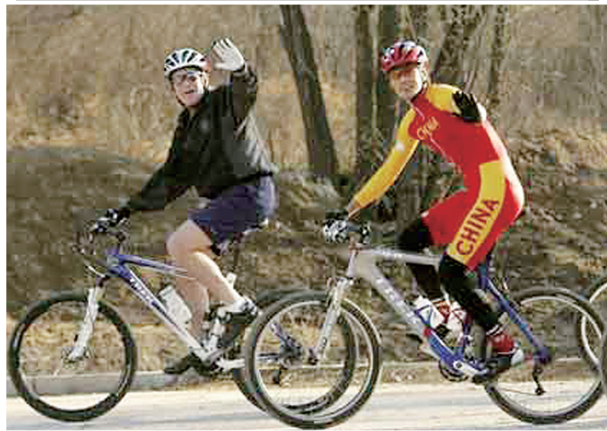
■把小布什和他父亲骑自行车的照片放在一起看,有一种历史沧桑感