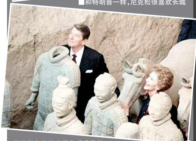
■里根和他的妻子参观兵马俑