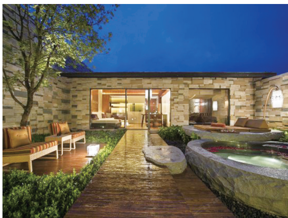
■石头纪 villa 酒店