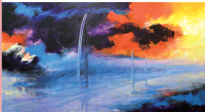
《海中的构成》系列之一 120x230cm 2018