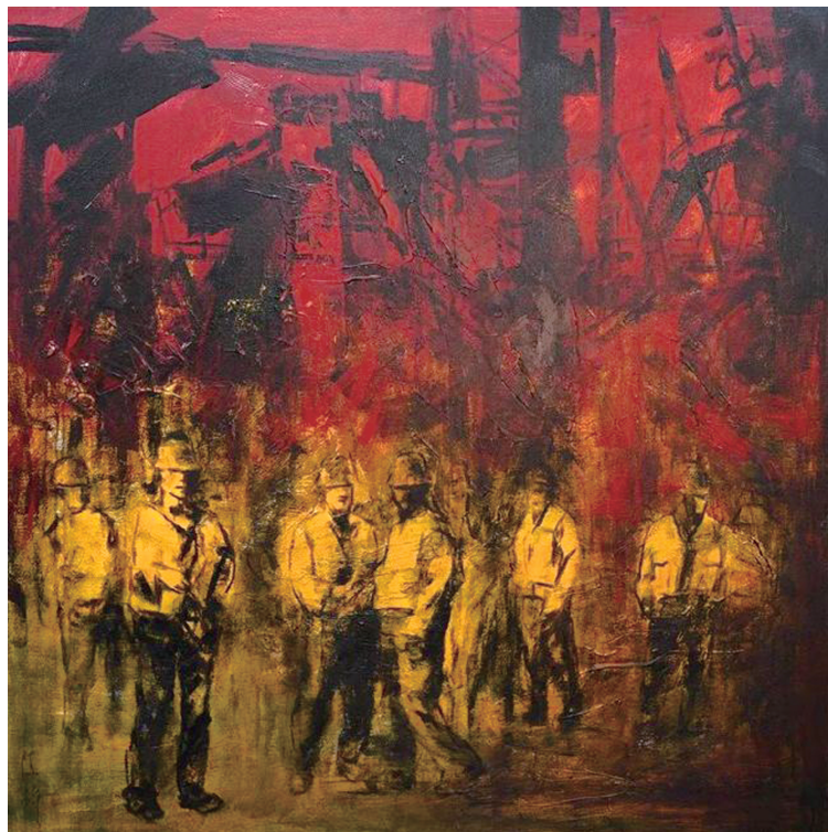
《海中的构成》系列之十一 160x160cm 2017

为了画好我心中美好的“桥”,全方位反映施工现场如火如荼的火热,反映大桥建设者吃苦耐劳、一往无前的大无畏精神,我每年几乎有三分之一时间,数十上百次深入现场去了解工程进度,在工地登吊塔顶,爬脚手架,甚至攀登附近荒岛山顶去捕捉瞬间即逝的场面。采访工程技术人员和工人,或画下素描速写和草图、或拍下照片,详细实录,积累了丰富的素材。感谢工人兄弟把我当作文化人,处处给我方便与支持,口渴了同喝一瓶矿泉水,烈日炎炎下工人师傅将阴凉处让给我,还给我很多好的建议。