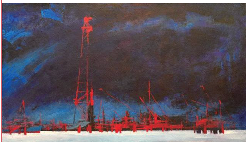
《海中的构成》系列之九 110x190cm 2013