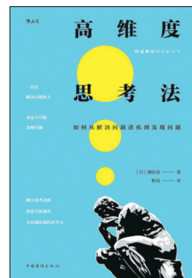
《高维度思考法》 程亮 译 【日】细谷功 著 中国华侨出版社

不断忙于解决已经发生的问题,甚至深陷其中焦头烂额,这是如今很多人面临的问题。本书的作者提出,实际上,在科技发展的今天,人们要做的是善于发现问题,如此才能防患于未然。作者说,为了发现尚处于未知领域中的问题,最关键的是提升思维的自由度,并且给出了提升的具体方法,教给读者跳出现有的思维障碍,站在全新的视角重新定义问题。