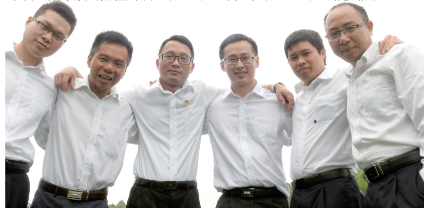
■六人团队合力提高供电服务水平

此外,云安供电服务中心团队还要跟踪做好故障停电、延迟停电、台风期间的客户服务工作,及时推送安抚信息。全年他们共推送信息48万条,有效减少客户诉求。同时,落实防范电费回收风险措施,团队对45户“七类”高风险客户采取多次抄表、担保、收取预付电费等措施,专人跟踪落实,并及时启动三级催收流程,推广多渠道、多元化的缴费方式,降低电费回收风险。截至2018年12月,该中心共收缴电费7.58亿元,累计电费回收率99.99%,顺利完成指标。