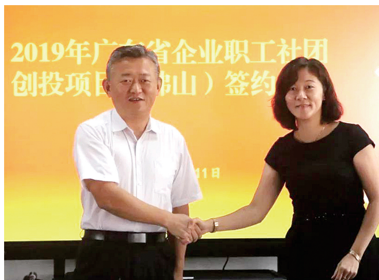
项目承办单位代表与佛山市总工会签约

佛山市总工会委托南海区社会服务联合会作为项目管理第三方。在项目实施过程中,佛山市总工会将联合管理单位,定期开展项目走访督导,跟踪进程、控制服务质量,审查项目的绩效情况。