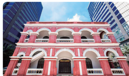
▲省港罢工委员会旧址