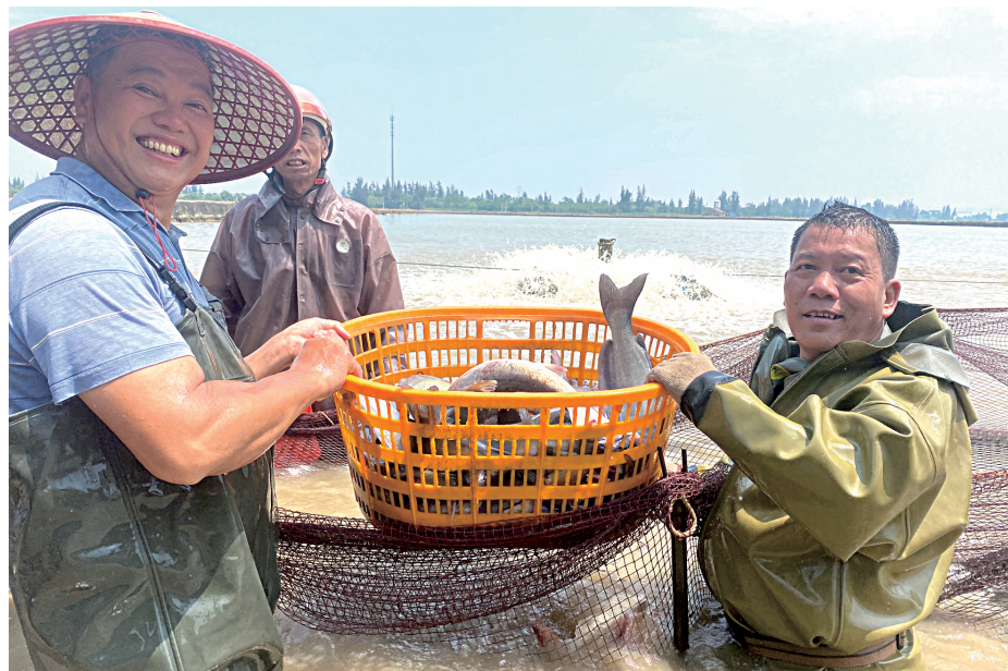
■台山养殖基地养殖业兴旺发达,员工收获满满幸福感

融通农业发展(广州)有限责任公司台山养殖基地(以下简称“台山养殖基地”)位于江门市台山市,所辖区域地跨广海、斗山、赤溪、海宴、川岛、深井六镇。台山基地虽然只有10名员工,但充分利用台山气候温和、水面资源丰富、地处粤港澳大湾区等区位和资源优势,通过产业转型升级、商业模式创新,创建集现代种业创新、生态健康养殖、饲料生产、精深加工、仓储物流、终端销售、数字渔业一体化的现代农业产业园,努力打造“基地+品牌+市场+金融”的水产全产业链,多措并举,扎实推进乡村振兴战略,取得了良好的社会效益和经济效益,并于日前获得“广东省工人先锋号”荣誉称号。