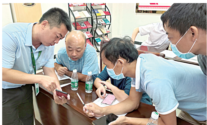
■台山养殖基地员工(左一)向养殖户演示讲解“农业i租”小程序使用方法

线,彰显了青春的蓬勃力量,展现出融通青年的风采。三是台山养殖基地根据群众反映的基地南塘地块路面年久失修、雨天路面积水、驻地群众出行困难的实际,在积极了解情况后,迅速制定修补方案,并组织相关人员与南塘村民一起对破损路面进行修补。经过5天的施工,1公里长的破损路面修复完好。修复后的路面不仅美观,还方便居民通行,为居民营造了便捷的出行和生活环境,切实提高了驻地群众的获得感、幸福感、安全感,得到群众的一致好评。