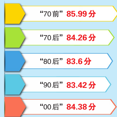
▲各年龄段评分情况